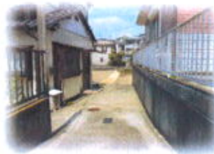
カースペース部分